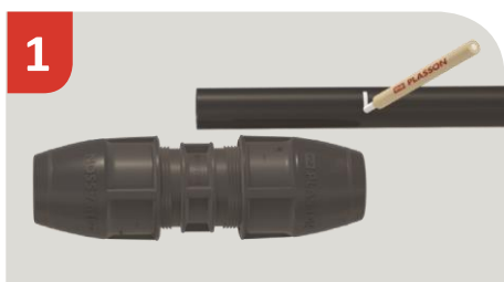
Označite globino vstavljanja